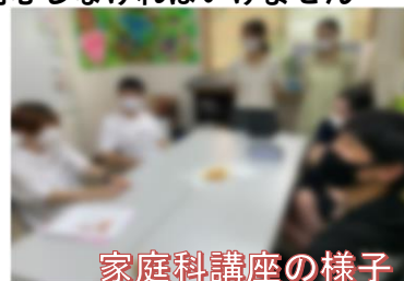
家庭科講座の様子